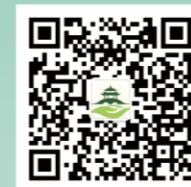
西湖益联保公众号