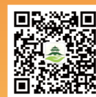
西湖益联保公众号