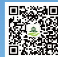
西湖益联保公众号